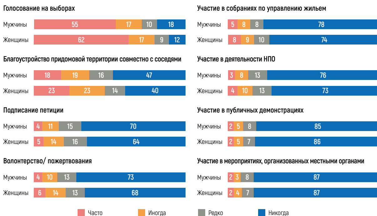
Рисунок 2. Гражданская активность по видам 10 , %

И мужчины, и женщины заявляют о весьма схожем низком уровне участия в политической деятельности, имеющей отношение к представительной демократии, например, участие в мероприятиях, организованных местными органами власти, или в публичных демонстрациях. Это может объясняться тем, что и женщины, и мужчины не видят большого смысла в участии в такого рода деятельности 9 , и/или местные органы власти не в достаточной степени вовлекают жителей в процесс принятия решений. В то же время голосование на выборах является наиболее распространенным видом деятельности среди мужчин и женщин: 79 и 72 процента (соответственно) голосуют часто.